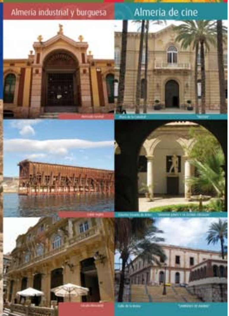
Almería industrial y burguesa